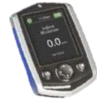
ECRAN Q-LOGIC 3