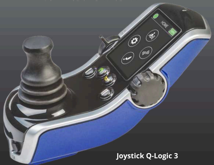
Joystick Q-Logic 3