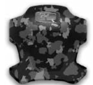
BLACK CAMO -BIENTÔT-