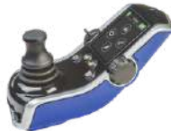
JOYSTICK Q-LOGIC 3