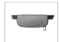
Boîte à gants sur accouoir