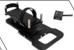
COMMANDE AU PIED