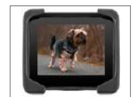
Caméra de recul