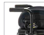
Barre de transfert