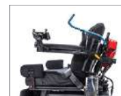
Bidon système d'hydratation