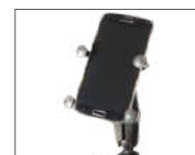
Support pour téléphone