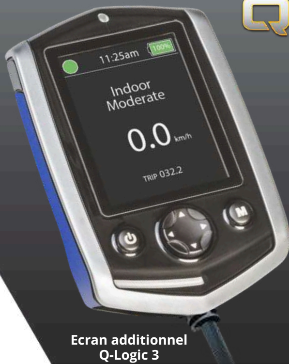
Ecran additionnel Q-Logic 3