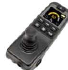
JOYSTICK Q-LOGIC 3E