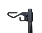
Crochet pour sac