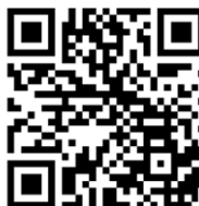
Lien vers codes LPP génériques et individuels + forfait